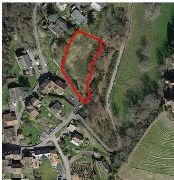
Parcelle N°8226 | Sentier du Chatelard 12

Rayon visé: Chailly sur Montreux, Tavel, haut de Clarens, partie de Brent