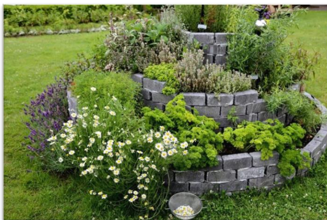
Exemple de spirales aromatiques de permaculture

Jardin ouvert ou clôturé (totalement ou partiellement) Partiellement clôturé