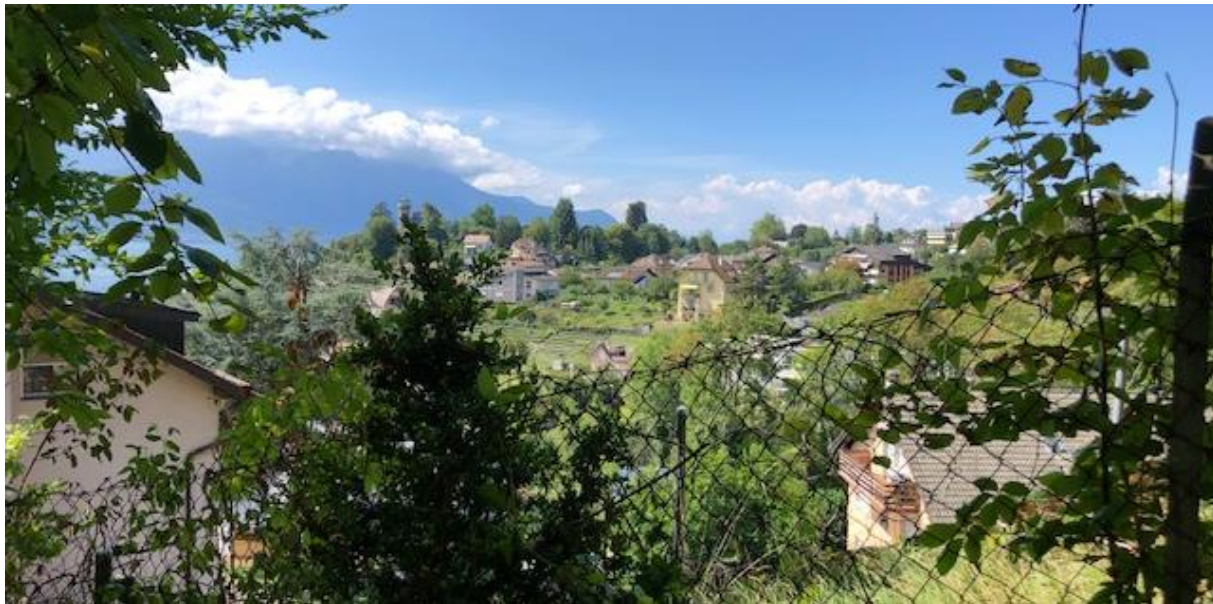
Vue depuis la parcelle n° 8226

En tant que citoyens et citoyennes de la commune nous sommes enthousiasmés par la possibilité de resserrer nos liens tout en léguant à la future génération des méthodes culturelles respectueuses de l'environnement.