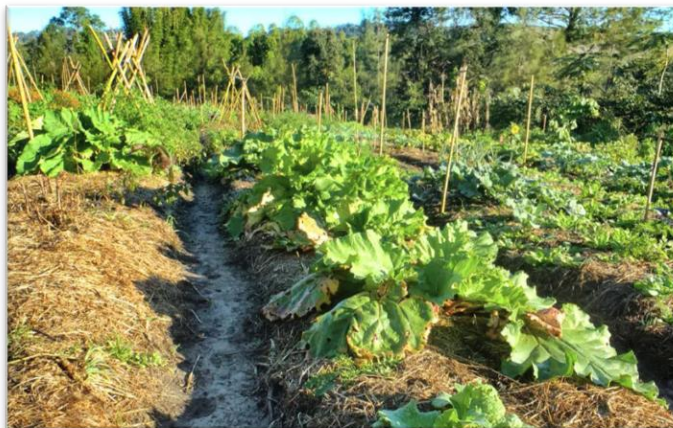
Exemple de buttes sandwichs de permaculture