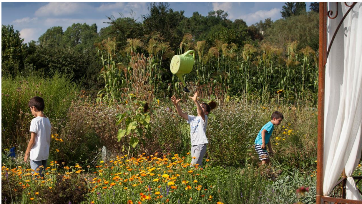
Un jardin pour tout les âges (image de bioterra.ch)

Schéma de zones en permaculture spécifique au terrain encore à élaborer.