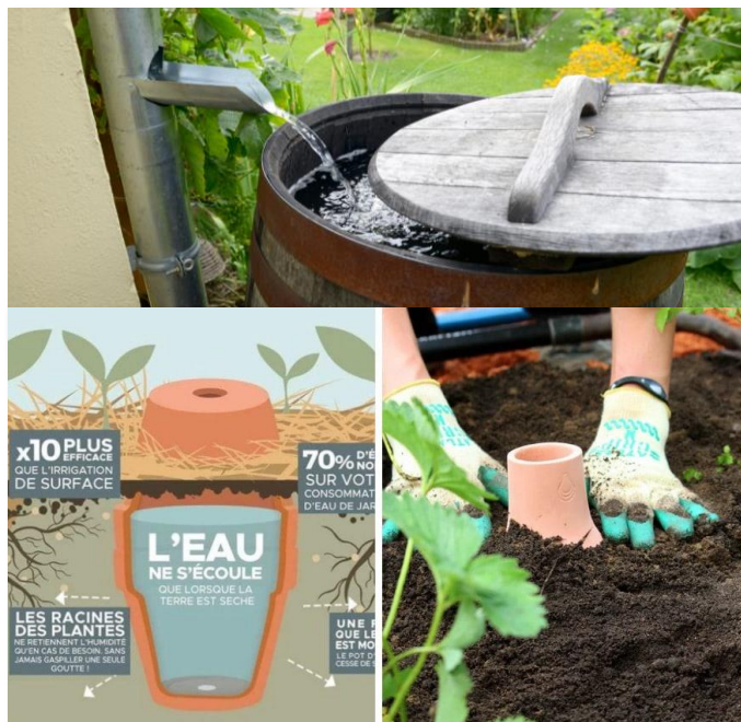
Réflexions sur moyens de récupérer l'eau

Schéma de zones en permaculture spécifique au terrain encore à élaborer.