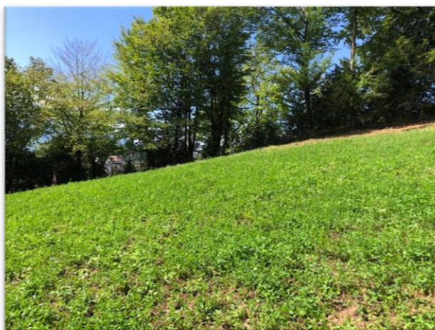
Photo de la parcelle été 2022 qui montre la pente